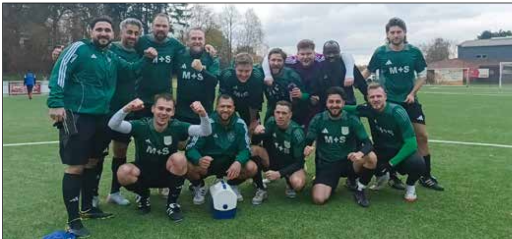
Das ist die Mannschaft, die in Hattingen-Niederwenigern einen Punkt gewonnen hat. Nie aufgeben und nicht verlieren wollen haben geholfen.