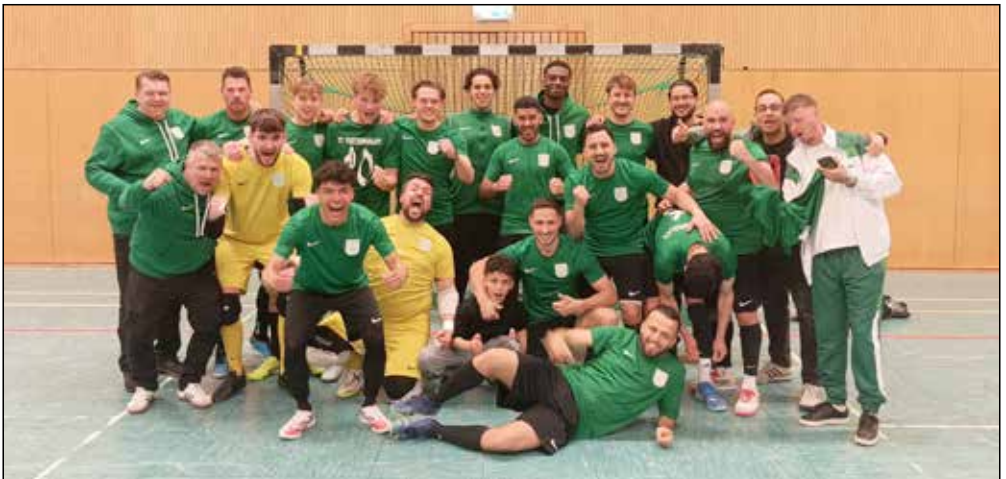
Verdienter Sieger, der zukünftig in der zweit höchsten Futsal-Liga Deutschlands spielt.