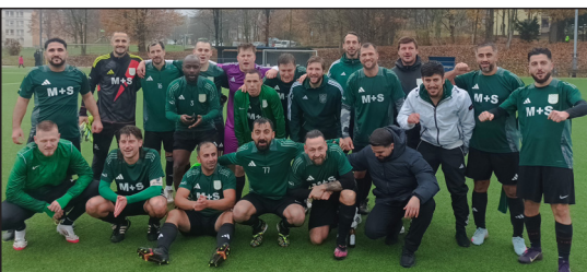
So sehen Derbysieger aus.